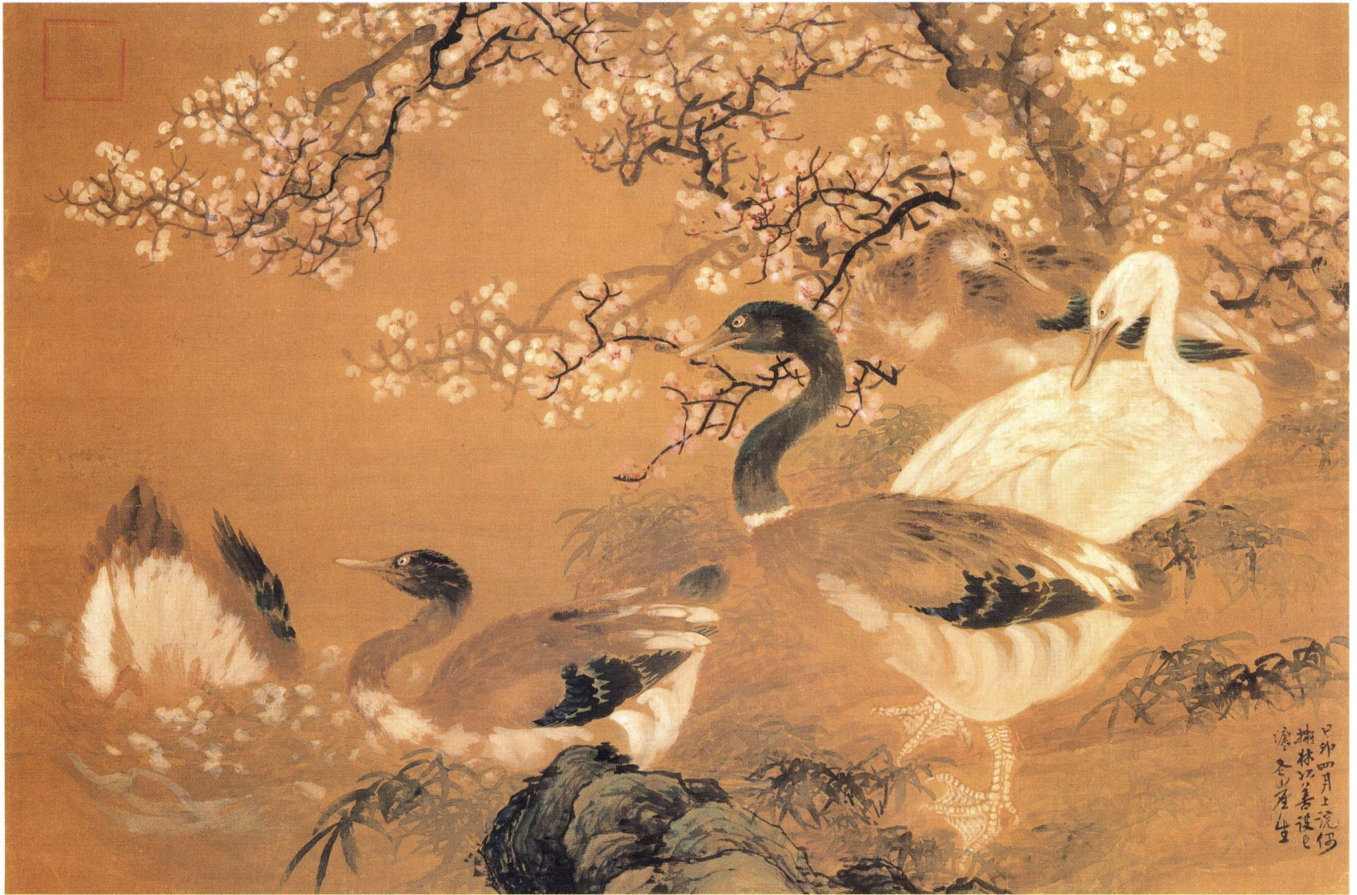
2 川上冬崖 《梅に水鳥図》 明治12年(1879)